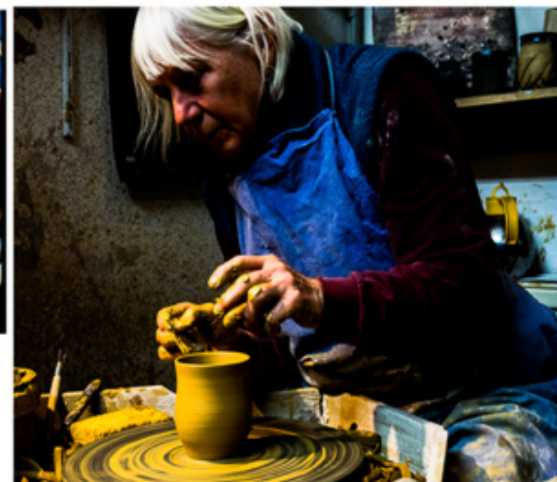
E I N B E C H E R