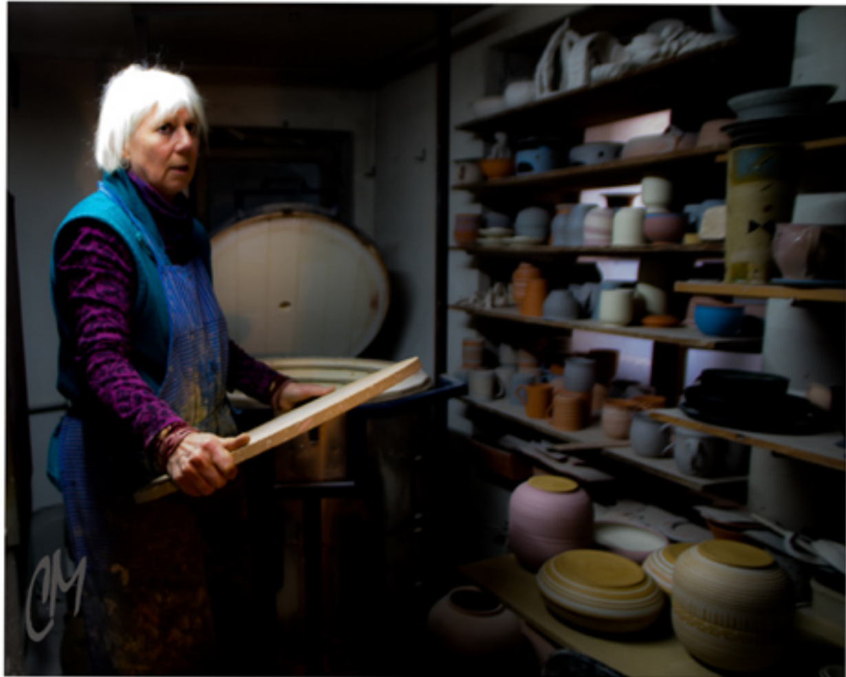
AUFFÜLLEN DES OFENS (1. BRENNEN)